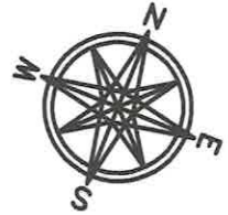
LOKALIZACJA MIESZKANIA W BUDYNKU